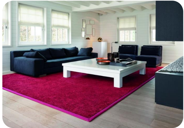
CONFORT Villandry - finition gansée