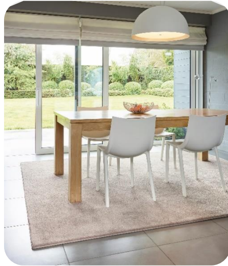
CONFORT Sully - finition galonnée

La gamme CONFORT propose 38 références de tapis élégants aux textures variées (bouclé laine, moyennes ou longues mèches) et au toucher ultra doux. Disponibles dans des teintes neutres ou très colorées, les tapis arborent une finition esthétique (gansée, galonnée ou rembourrée).