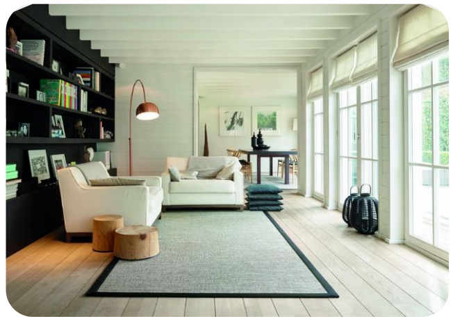
NATURE Pavillon Design Tweed - finition gansée