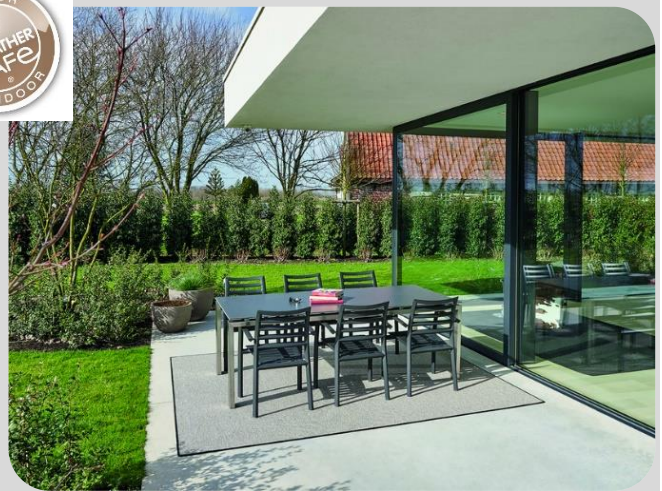
NATURE Pavillon Sunrise - finition galonnée Usage OUTDOOR