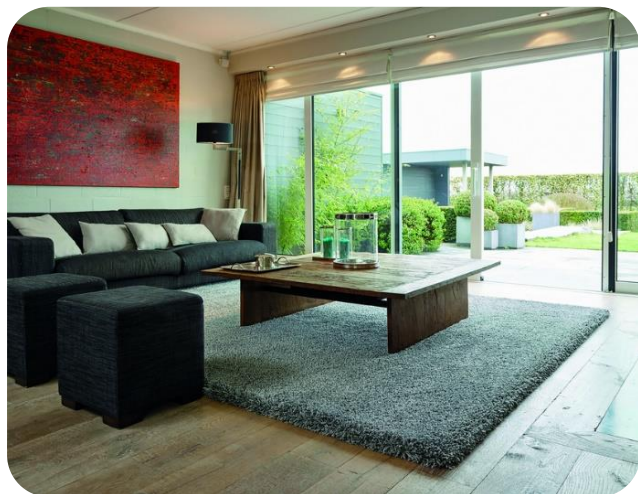
Gamme CONFORT, réf. Vauban, finition rembourrée

UDIREV présente la nouvelle collection de tapis de moquette sur-mesure « COUTURE 2020 ». Composée de deux volumes, CONFORT et NATURE, cette offre réunit 70 références pour une grande variété de coloris et de finitions. Personnalisables au gré des envies et des besoins de décoration ou de confort, ces tapis de moquette sont confectionnés en France en seulement 10 jours. Les tapis de la gamme NATURE, imperméables et imputrescibles, sont appropriés aux usages outdoor .