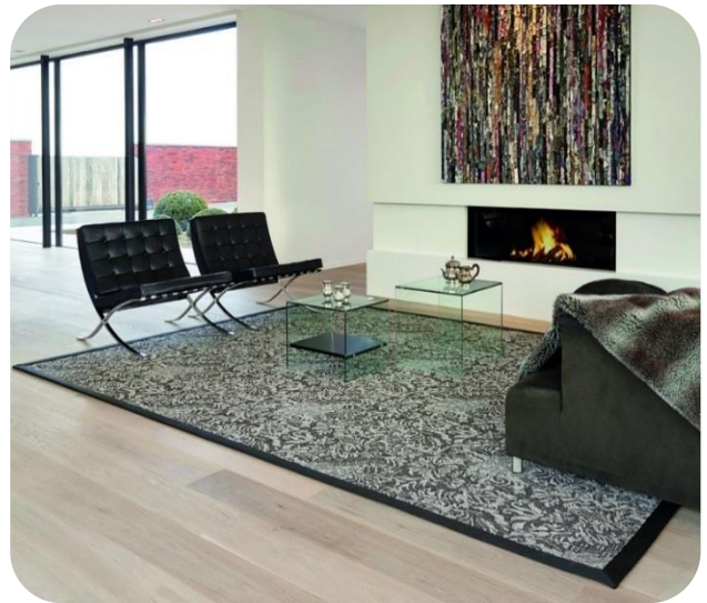
NATURE Pavillon Vintage Floral - finition gansée

Imperméable et imputrescible, NATURE est adaptée pour un usage outdoor (terrasses, balcons...).