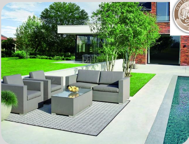
NATURE Pavillon Design Chevron - finition galonnée Usage OUTDOOR