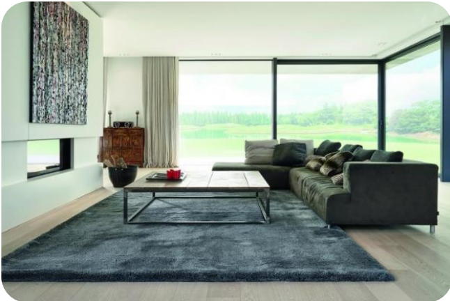
CONFORT Chaumont - finition rembourrée