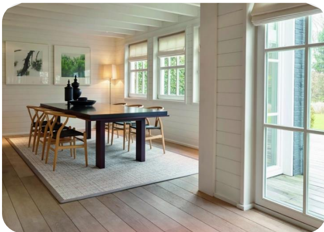
NATURE Pavillon Vintage Square - finition gansée