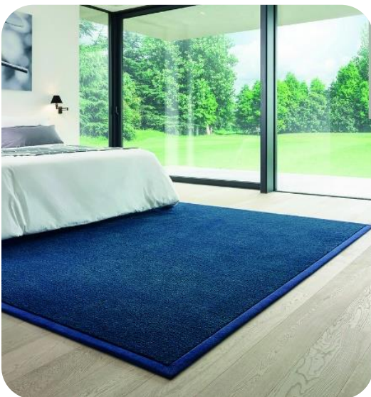
CONFORT Valençay - finition gansée