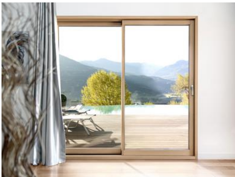
Baie coulissante Ciméal 2 vantaux Finition intérieure Chêne Champagne

Performances d'isolation thermique U_w = 1,4 \text{ W}/(\text{m}^2.\text{K}) avec double vitrage 4/20/TBE 4 Argon avec Warm Edge+