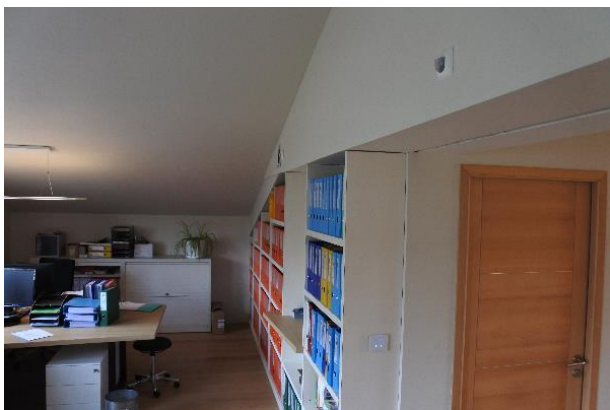
Le PresenceLight dispose d'une zone de détection à 180° pour un rayon de détection de 8 m.

La mise en service de l'alarme provoque l'extinction des éclairages du bâtiment, alors que la mise hors service rétablit le fonctionnement des éclairages via les détecteurs de présence.