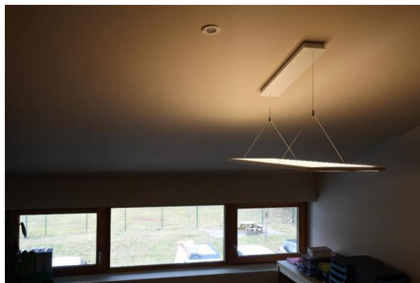
Avec son design plat, le PlanoSpot 360 KNX, s'intègre discrètement aux plafonds.