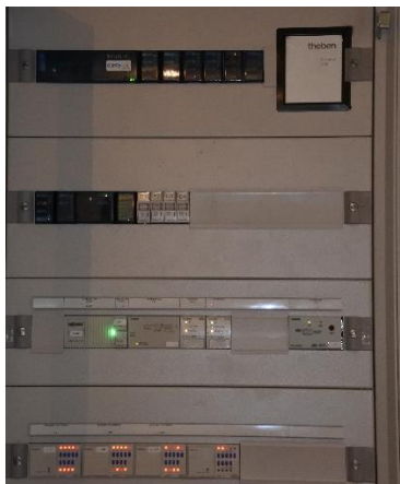
Le micro-serveur TheServa S110 est conçu sans ventilation pour un fonctionnement continu.

Le bâtiment est également pourvu d'une station météorologique Meteodata 140 S Theben qui mesure en temps réel le vent, la pluie ainsi que la luminosité et la température extérieure. Ces informations sont transmises via le réseau KNX au theServa S110. Ainsi, les données et les prévisions météorologiques sont consultables directement sur les supports numériques. « Les retours sont positifs, affirme Romain Gianotti. Les utilisateurs se rendent compte que l'interface est claire et intuitive. De n'importe quel endroit, à n'importe quel moment, l'utilisateur peut contrôler l'éclairage, suivre les prévisions météorologiques et la consommation énergétique. »