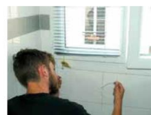
► Préparation des câbles du store guidé.