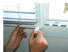
► Pose du câble support bas.