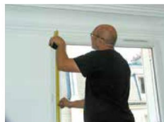
► Prise de cotes gauche et droite pour le positionnement des supports de fixation.