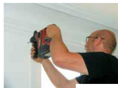
► Avec une perceuse à percussion perçage des trous de fixation.