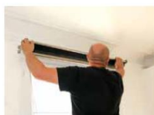
► Mise en place du store enrouleur.