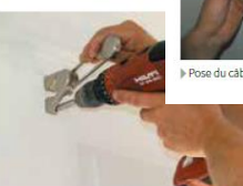
► Vissage des vis de fixation des supports.