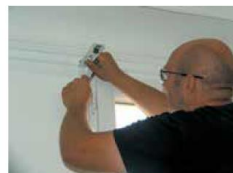
► Installation des clips en aluminium, fixation murale du rail avec des équerres, traçage des trous de perçage.