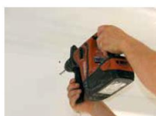
► À l'aide d'une perceuse à percussion, réalisation des trous de fixation du support.