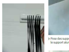
► Pose des bandes verticales du