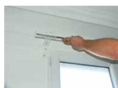
► Installation du rail sur les clips aluminium.