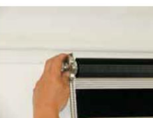
► Réglage du positionnement du support rouleau.