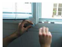
► Fixation des supports bas du store vénitien guidé, à l'aide d'une clé six pans.