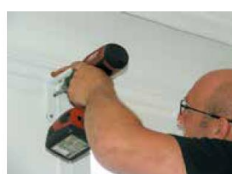
► Vissage des supports de fixation, à l'aide d'une visseuse déviseuse.