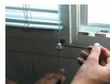
► Installation et serrage des câbles du store guidé.