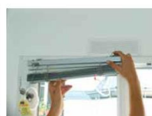
► Mise en place du vénitien sur le châssis de la fenêtre.