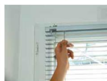
► Fixation de la tige d'orientation des lamelles du store vénitien.