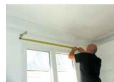
► Muni d'un mètre à ruban, repérage et traçage du second support, afin de réaliser la fixation.