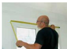
► Prise des cotes de la fenêtre, afin de déterminer l'emplacement des supports du store.