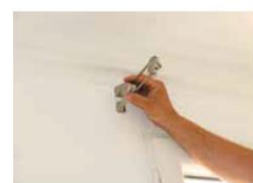
► Positionnement du support pour déterminer le perçage des trous de fixation.