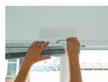
► Serrage des supports du store sur la fenêtre, à l'aide d'une clé six pans.