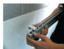
► Pose des supports sur le vénitien, en clipsant le support aluminium sur le cadre.