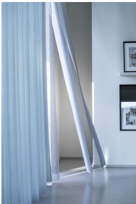
Les bandes en voile, souples et légères, laissent passer l'air ou les occupants