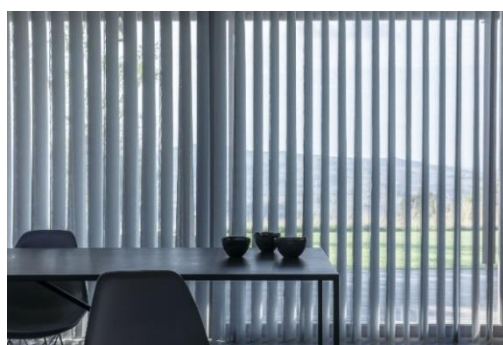
La gestion de l'occultation du voilage se fait facilement grâce à la tige d'orientation