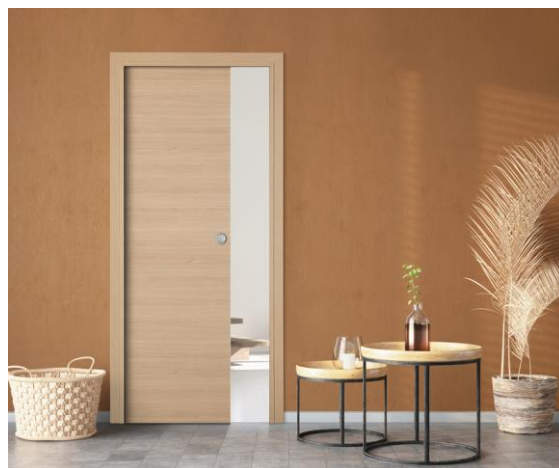
KREATION – Porte à galandage avec habillage assorti M03A

Le châssis coulissant métallique n'est pas fourni, mais les portes à galandage KREATION sont compatibles avec la plupart des marques du marché. De plus, les usinages pour serrure, poignée cuvette et tire doigt, sont possibles.