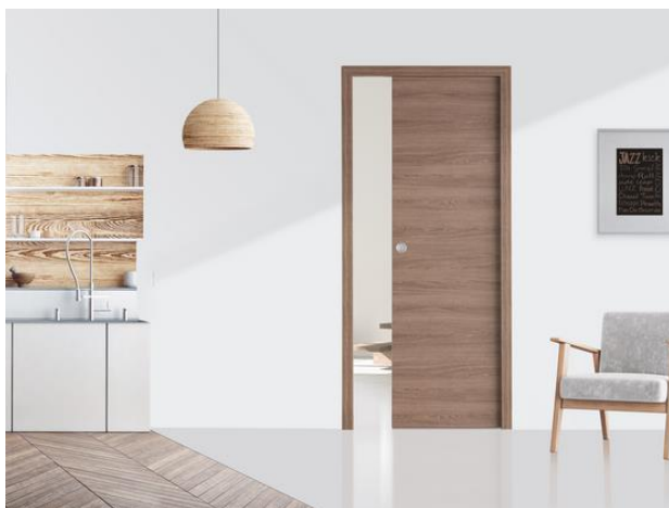
KREATION – Porte à galandage avec habillage assorti M05

Exclusivité de RIGHINI, les portes KREATION sont les seules portes intérieures mélaminées fabriquées en France et garanties 5 ans. Dans sa version à galandage, la porte coulissante est accompagnée en option d'un habillage entièrement assorti au décor de la porte, un plus déco qui valorise la chaleur et la modernité du matériau bois. L'habillage s'adapte aux cloisons en plaque de plâtre d'épaisseur 98 mm. Caractéristiques du vantail : hauteur de 2 040 mm et largeurs de 730, 830, 930 et 1 030 mm.