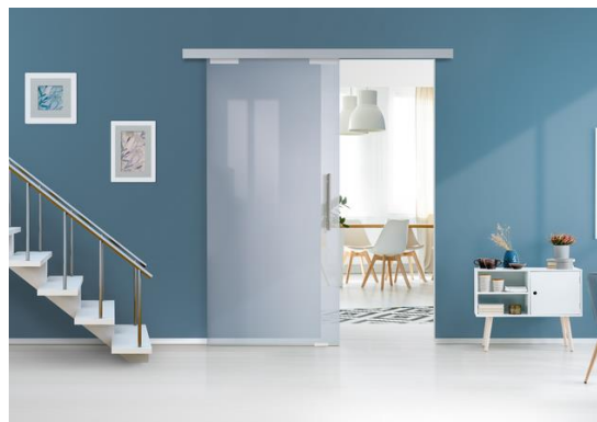
LUMYS VERRE – Verre mat - séparation entre le salon et la salle à manger