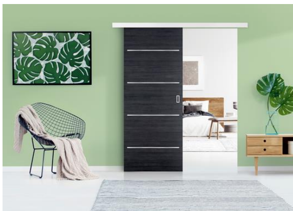
LUMYS BOIS avec porte KREATION 4H M06

Le choix d'une porte décorative KREATION ou KREATION LINE apporte un cachet résolument moderne et design aux pièces de l'habitat. Le panneau est fixé par mécanisme de roulettes sur la traverse haute du vantail (rail aluminium de longueur 2 000 mm).