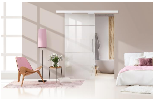
LUMYS VERRE – Verre mat 4R – séparation entre la chambre et la salle de bain dans une suite parentale

La porte coulissante en verre de sécurité LUMYS apporte luminosité et légèreté aux intérieurs. La fixation s'effectue par deux pinces montées sur roulettes, sur un rail en aluminium de 2 000 mm max. Les dimensions de la porte sont : épaisseur de 8 mm, largeurs de 830 ou 930 mm, hauteur de 2 040 mm. 3 modèles de verre sont disponibles : verre clair, verre mat et verre mat 4R (modèle rainuré).