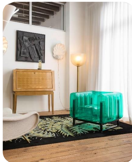
Fauteuil YOMI vert (300 € TTC)