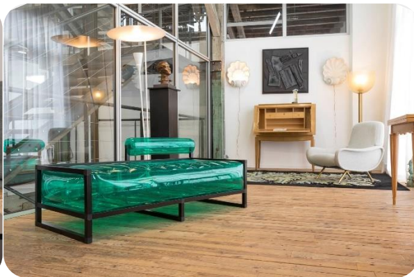
Méridienne YOKO vert (275 € TTC)