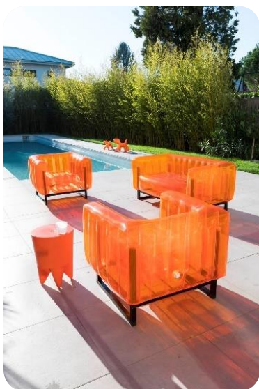
Salon YOMI orange