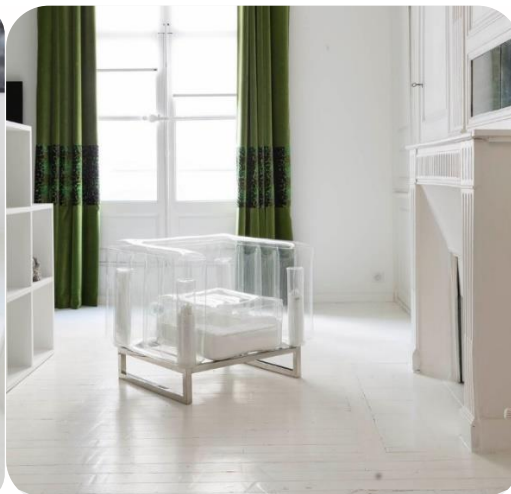
Fauteuil YOMI rempli de billes flottantes et ossature inox