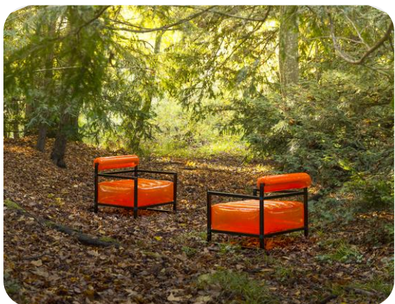
Fauteuils YOKO orange