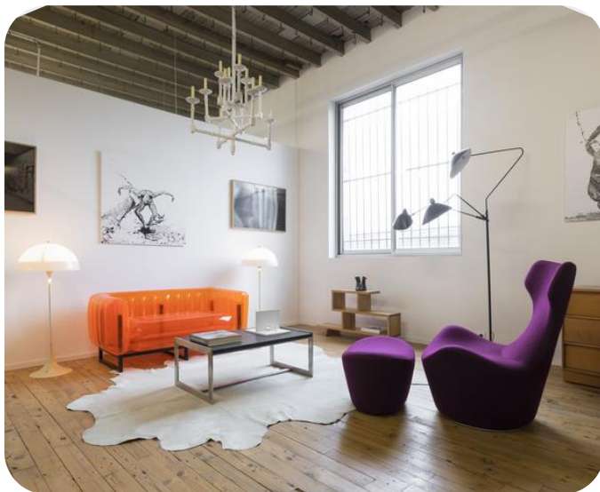
Canapé YOMI orange (425 € TTC)

Avec YOMI , on affirme sa différence ! Des formes intemporelles - à la fois contemporaines et vintage - pour un mobilier qui s'associe en harmonie avec tous les styles de décors.