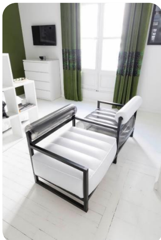
Esprit Ying & Yang avec ce Confident composé de deux fauteuils YOKO, baptisé le « Talk » (300 € TTC)

Association de matières et de couleurs, la gamme COLLECTOR crée un univers totalement décalé ! Des modèles aux finitions premium, des coloris ou des créations uniques... pour un résultat explosif !