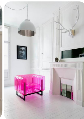
Fauteuil YOMI rose (300 € TTC)