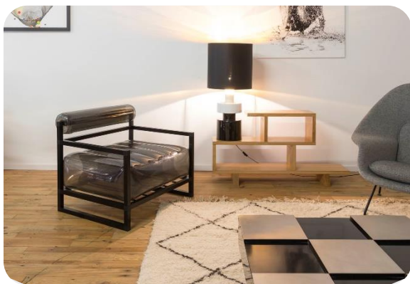
Fauteuil YOKO fumé (175 € TTC)

YOKO , c'est la bonne idée pour un style de vie chic ! Des lignes audacieuses anticonformistes, des volumes justes et équilibrés, qui reflètent un style urbain dépouillé et design.