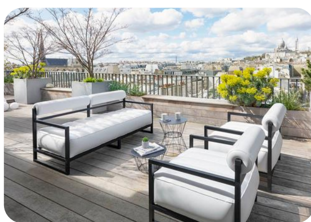
Salon YOKO blanc (le canapé : 300 € TTC)