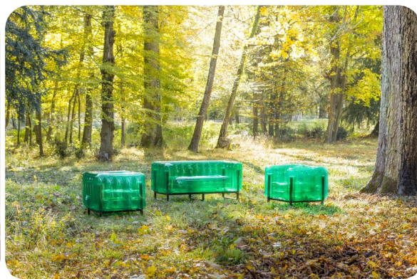
Salons YOMI orange et vert

Le mobilier MOJOW, conçu en partenariat avec le nouveau laboratoire de tendances GALLIERI DESIGN (Groupe AXXESS), est une offre accessible à tous (tarifs de 175 € TTC à 425 € TTC), facile à transporter puis installer (15 minutes pour assembler un fauteuil).