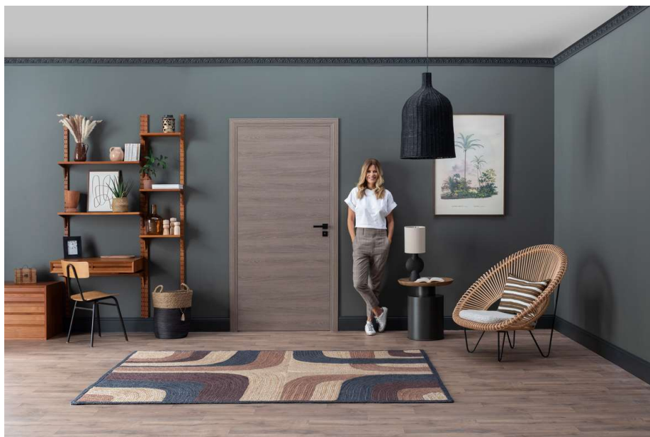
Décor réalisé avec la porte KREATION (M05) teinte chêne taupe Lien de la vidéo Master Class : https://youtu.be/qxVUg5iTZOg

L'ambiance VINTAGE CALIFORNIEN s'inspire des maisons californiennes des années 50 et 70. Elle se caractérise par des couleurs vives, des motifs audacieux et une utilisation de bois et de cuir.