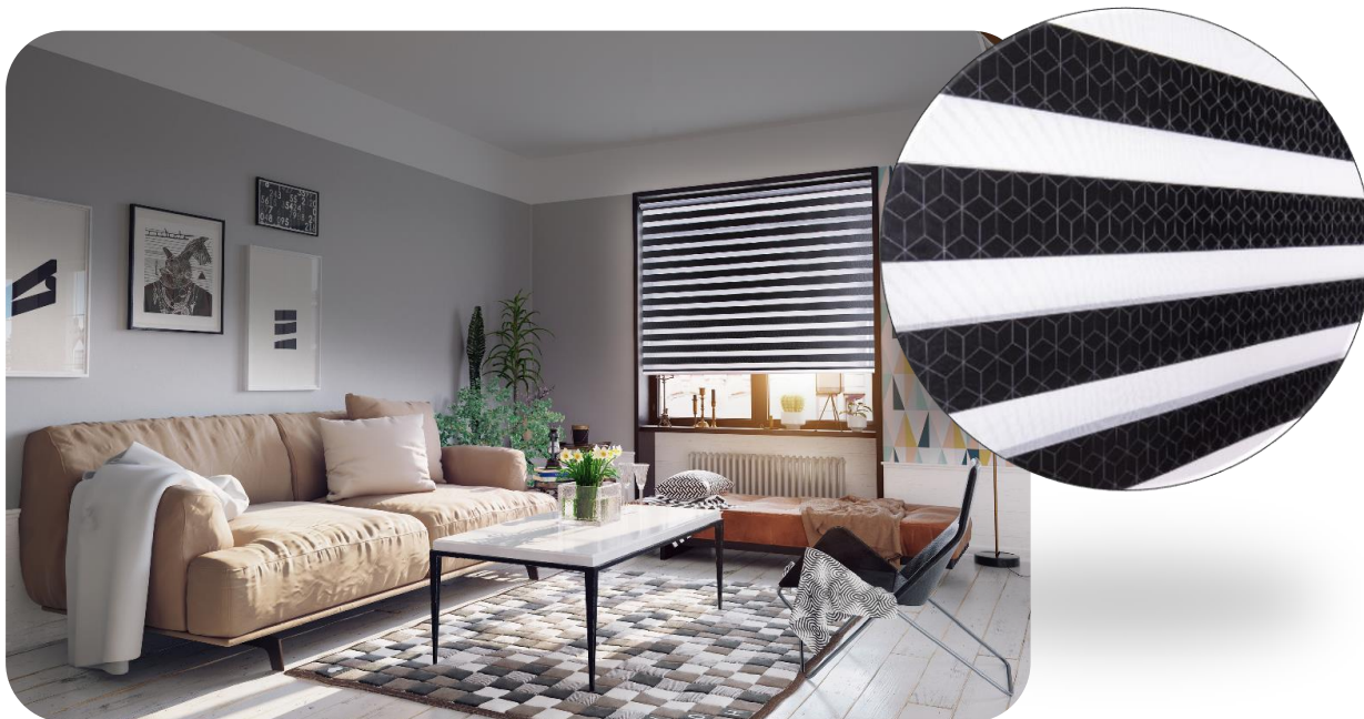
Store intérieur à enroulement OPTIMA 2 Night & Day Origami. Dimensions 1 200 x 1 350 mm. Prix public conseillé : 224,40 € TTC (hors pose). Garantie 2 ans.

L'art ancestral japonais de l'origami continue d'inspirer la mode, l'architecture et la décoration. Aujourd'hui, cet art du pliage papier aux formes géométriques qui insuffle une ambiance Feng-shui, chic et graphique, s'invite sur les stores à enroulement Night & Day de Storistes de France.